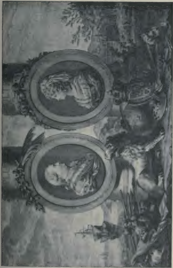
Medaillon du roi Charles IV et de la reine Marie-Louise. Dessiné et gravé par Manuel Salvador Carmona.